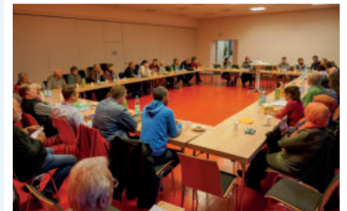
Einmischung: Borner Runde 2017