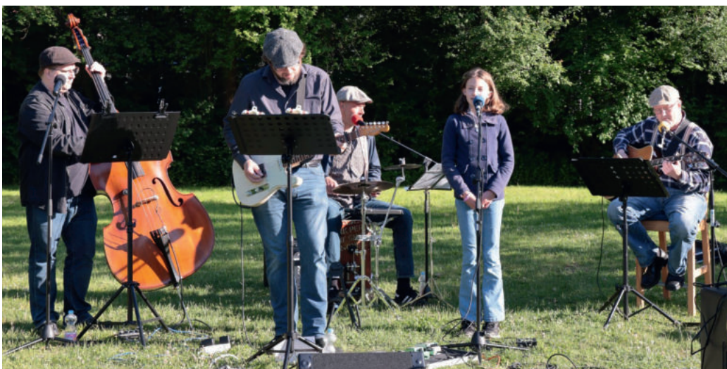
Die CowBirds mit junger Unterstützung