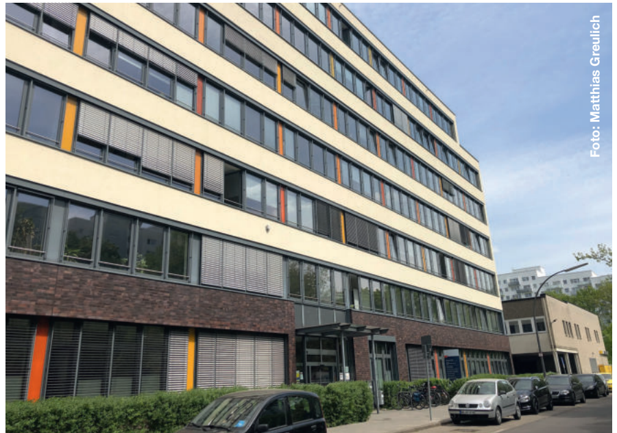
Möglicher Standort für das mobile Kundenzentrum: Die Stadt hat das Gebäude in der Bornheide 47a gemietet

Das Kommunikationsproblem mit den Aktiven am Born hatte Ende Mai auch