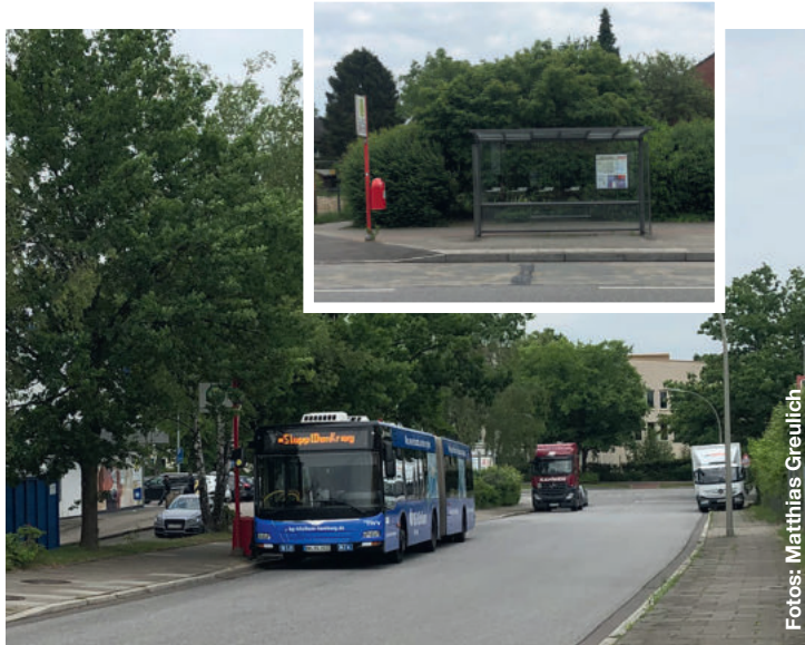
Oben: die Endhaltestelle des 16ers am Rugenfeld. Unten: der Bus macht Pause am Brandstücken

MetroBus-Linie 21 in die MetroBus-Linie 16 umzusteigen“, so Sprecherin Lena Steinat. Grundsätzlich gelte für die Hochbahn: Anpassungen im Netz führten grundsätzlich auch zu Veränderungen. In manchen Fällen lasse es sich nicht vermeiden, dass einzelne Direktverbindungen anschließend nicht mehr vorhanden sind. Maßgebend für die Planung sei, dass die „Vorteile des veränderten Linienwegs überwiegen und eine Verbesserung für das Gesamtnetz darstellen“.