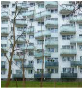
Der Osdorfer Born

Gegensätze ziehen sich an, sagt man. Gemeint sind damit meist Menschen. Aber gilt das vielleicht auch für zwei Quartiere eines Stadtteils, die unterschiedlicher kaum sein könnten?