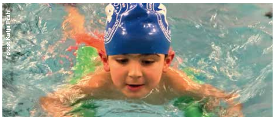
Ein LuFisch-Kind lernt schwimmen