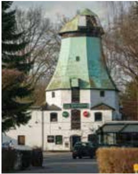
Die Osdorfer Mühle