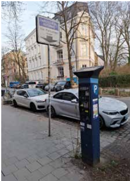
Wird es bald teuer in Osdorf?

Im Oktober 2025 haben die Hamburgerinnen und Hamburger mit einer knappen Mehrheit von rund 53 % für eine Verschärfung des Hamburgischen Klimaschutzgesetzes gestimmt. Danach ist jetzt gesetzlich vorgesehen, dass Hamburg bis 2040 klimaneutral werden muss und jährlich verbindliche CO 2 -Minderungsziele festzulegen sind.