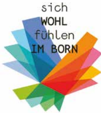
Die Gesundheitsbroschüre für den Osdorfer Born